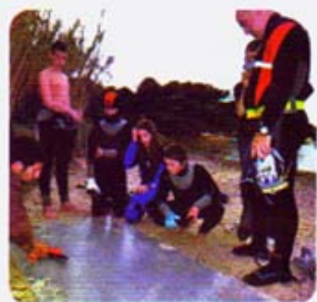
Pain gagné grâce à la mobilisation de chacun.