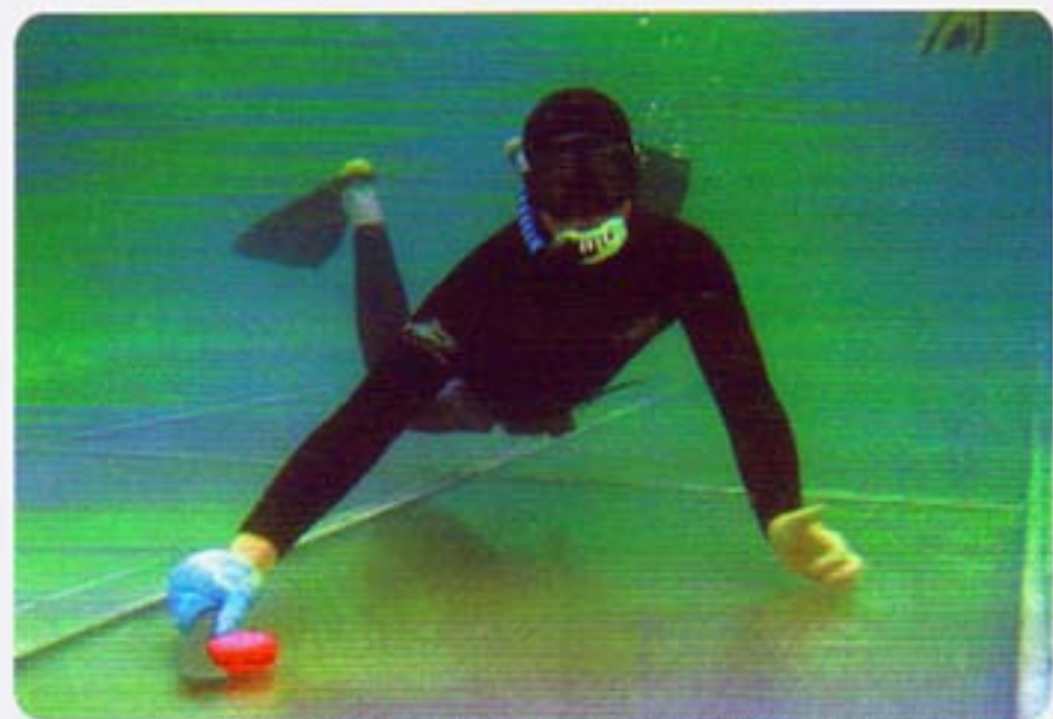
Un an de travail pour trouver la solution permettant de revenir aux îles et installer un terrain en mer.

En novembre, à l'occasion des Rie à Porquerolles, le club Hyères hockey subaquatique a inventé une nouvelle façon de pratiquer avec... un terrain installé en mer! La glisse est excellente, le terrain se place à la profondeur désirée. Souvenirs inoubliables, avec à la clé l'initiation de plusieurs dizaines de jeunes venus de toutes les régions décou-